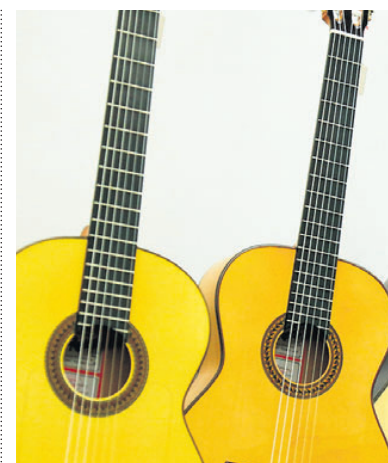
Gitarrenbauer stellen aus.

In sein Programm hat Pepe Romero viele bekannte Gitarrenstücke gepackt - zu hören heute Abend, dank grosszügiger Unterstützung durch die Hans-Gröber-Stiftung, um 20.15 Uhr im Gemeindesaal Mauren. (pd)