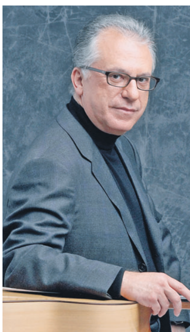
Jubiläumskonzert heute an den Ligita: Pepe Romero von der «königlichen Familie der Gitarrenmusik».

Im Alter von sieben Jahren steht Romero das erste Mal auf der Konzertbühne und es begann eine Karriere, die ihn über die grossen Bühnen Europas hinaus zu den bekanntesten Konzerthäusern auf der ganzen Welt führt. Für seine unglaubliche Virtuosität, seine faszinierenden Interpretationen und seine perfekte Technik wird er gefeiert. Weit über 60 Tonträger gibt es inzwischen und er hat mit fast allen grossen Dirigenten seiner Zeit zusammengearbeitet.